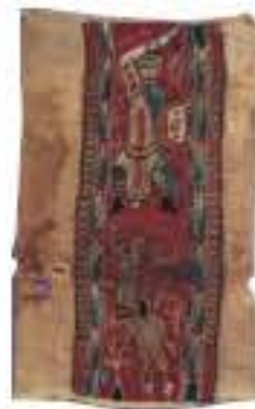
Τμήμα κοπτικού υφάσματος (μαλλί και λινό) με σκηνή κινήσιου. Πιθανότατα προέρχεται από κάποιο παλιό που διακοσμούσε τους κοπτικούς χιτώνες από τον ώμο μέχρι τα γόνατα. Εικονίζεται κινήσιος με κοντό έριφος και ασπίδα που κινητά σιλουαρσιδές ή ίσιως κομήτα. Υψ. 24,8 εκ., 7ος-8ος αι.,