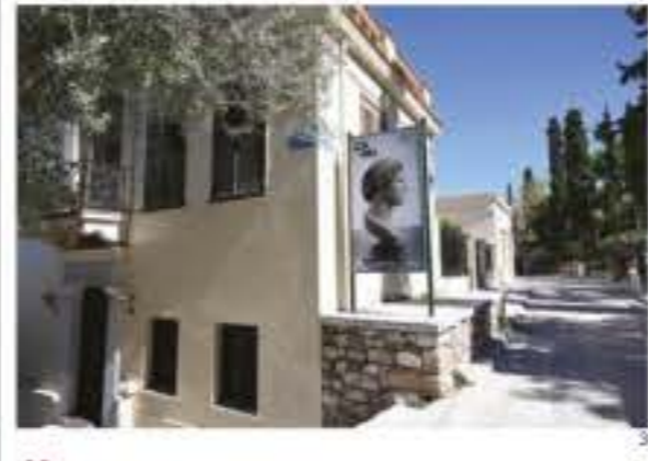
7-3 Το σωτηρικό και το ξεινερικό του Μουσείου Κανελλοπούλου στην οδό Θεωρίας στην Πλάκα.

ληνικό κράτος με σκοπό να εκτεθεί σε κατάλληλα διαμορφωμένο μουσείο. Για τη στέγαση της συλλογής το υπουργείο Πολιτισμού επέλεξε τη νεοκλασική οικία Μιχαέλα στην οδό Θεωρίας και Πανός στην Πλάκα, η οποία είχε απαλλοτριωθεί το 1963, ένα σημείο ιδανικό, τιμητικό και νεοραλικό, κάτω από την Ακρόπολη. Οι εργασίες μετατροπής του κτιρίου σε μουσείο ξεκίνησαν το 1969 και το 1972 η συλλογή μεταφέρθηκε εκεί. Ταυτόχρονα, έγινε συντήρηση των εκθεμάτων στο Εθνικό Αρχαιολογικό Μουσείο και στο Κέντρο Συντήρησης Αρχαιοτήτων. Το 1976 το Μουσείο Π. & Α. Κανελλοπούλου άνοιξε για το κοινό του. Το 2004 ξεκίνησαν οι εργασίες για την επέκτασή του σε όμορο οικοπέδο, το οποίο αγοράστηκε με έξοδα της Αλεξάνδρας Κανελλοπούλου και δωρήθηκε στο Δημόσιο. Η κατασκευή ολοκληρώθηκε το 2007 με δαπάνη του Ιδρύματος Παύλου και Αλεξάνδρας Κανελλοπούλου, το οποίο είχε ιδρυθεί το 1999 με σκοπό την υποστήριξη του μουσείου και γενικότερα δράσεων πολιτισμού και εκπαίδευσης. Σήμερα είναι Νομικό Πρόσωπο Δημοσίου Δικαίου, εποπτευόμενο από το υπουργείο Πολιτισμού.